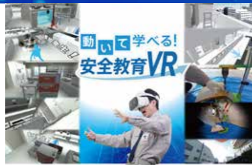
制作期間: 4ヶ月程度