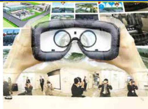
制作期間: 5ヶ月程度

工業団地における大型事業の周知を目的とした展示会を、企画から一貫して弊社で担当させていただきました。事業全体を俯瞰した説明から始まり、メインの建屋における機器の紹介や、目に見えないエネルギーサービスの流れを VR を利用してインパクトある形で PR しています。