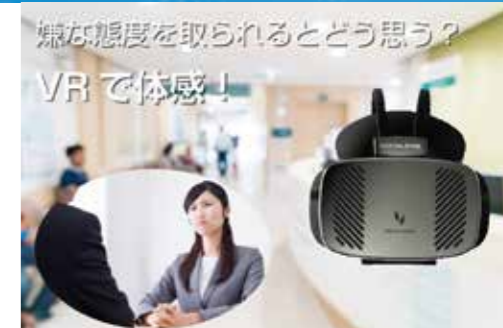
制作期間: 4ヶ月程度

受付の従業員に不躰な態度を取られるとどう思うかを体験し、問題点を体感しながら啓蒙することを目指した VR コンテンツ。企画・シナリオ構成から演者の手配や撮影、スティッチング作業まで一貫して担当しています。