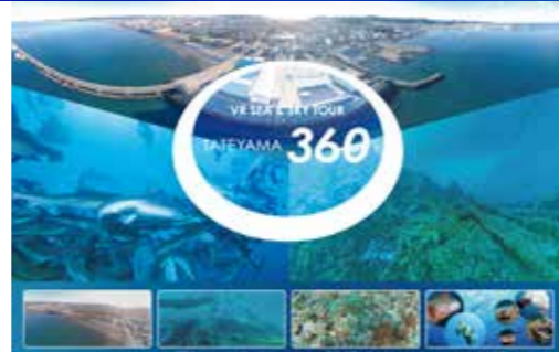
制作期間: 6ヶ月程度

千葉県館山市 "渚の駅" たてやまにて、絶賛公開中の VR コンテンツを制作。館山の魅力を空から、海から! 言葉だけでは伝わらない地方の魅力を伝えるために、ドローンを使った 360 撮影、そして海中での 360 撮影を行っています。